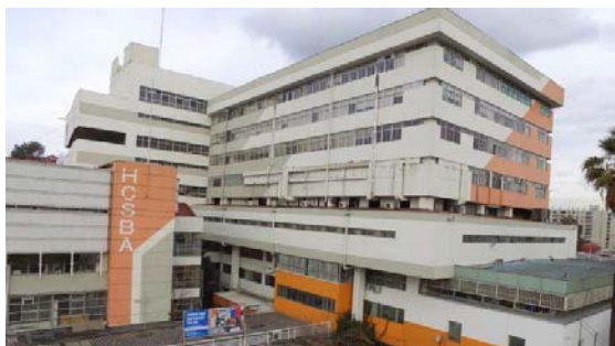
Unidad de Infectología Hospital San Borja Arriarán